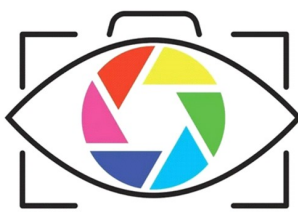
CLUB PHOTO ANGERS LA MADELEINE