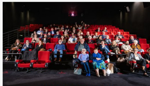
SOIRÉE DES LAURÉATS 2024