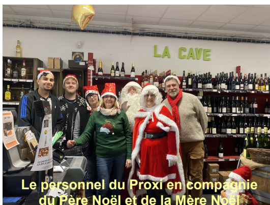
Le personnel du Proxi en compagnie du Père Noël et de la Mère Noël