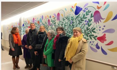
FRESQUE PARTICIPATIVE À L'ICO 49

Le Fonds de dotation intervient sur des sujets d'intérêt général tout comme les fondations et les associations.